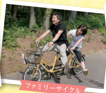
ファミリーサイクル