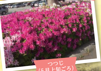
つつじ (5月上旬ごろ)