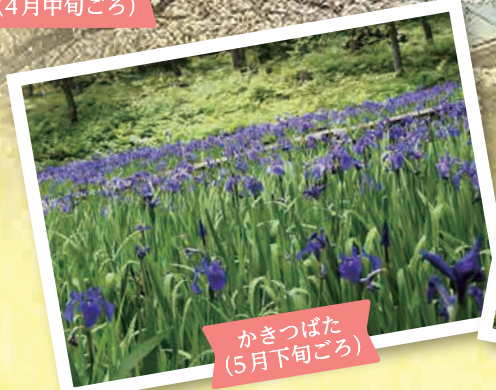
かきつばた (5月下旬ごろ)